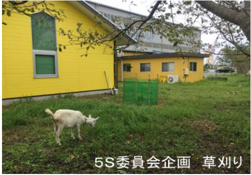
5S委員会企画 草刈り