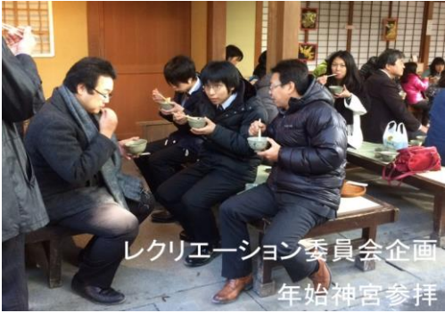
レクリエーション委員会企画 年始神宮参拝