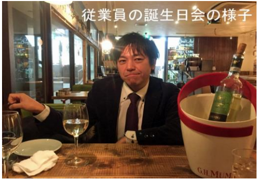
従業員の誕生日会の様子