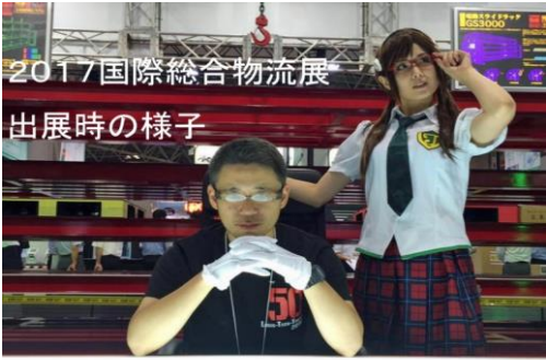
2017国際総合物流展 出展時の様子